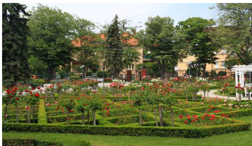
Texte 2: roses park

https://www.tripadvisor.co.uk/LocationPhotoDirectLink-g298478-d3226233-i100042590-Roses_Park-Timisoara_Timis_County_Western_Romania_Transylvania.html